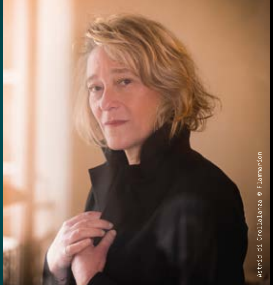
Astrid di Crolianza